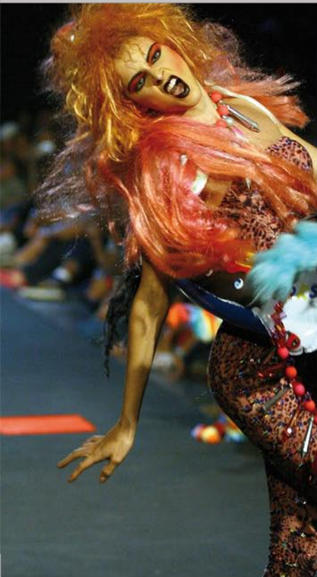
Semana de la moda de Sao Paulo (Brasil). Febrero 2004